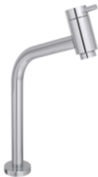
Referência de torneira de mesa bica alta cromada