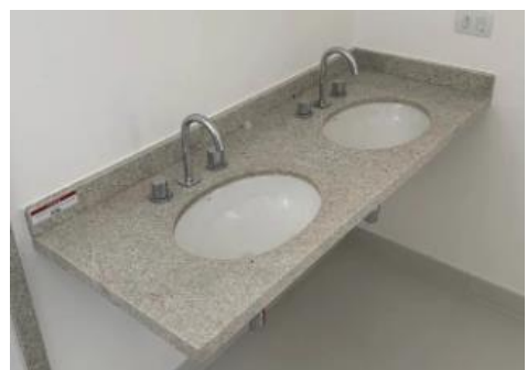
Referência de bancada com cuba de embutir oval