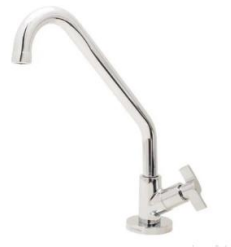
Referência de torneira de bancada cromada