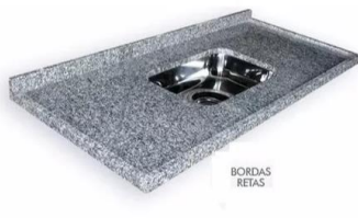
Referência de pia de granito com 1 cuba inox