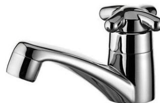
Referência de torneira de mesa cromada