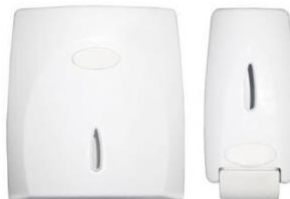
Referência de dispenser para papel toalha e para sabonete líquido