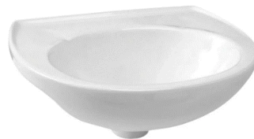
Referência de lavatório suspense