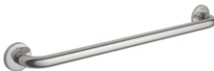
Referência barra de apoio