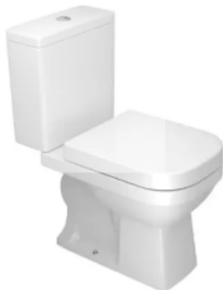
Referência de bacia sanitária com caixa acoplada