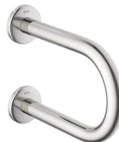
Referência de barra de apoio para lavatório