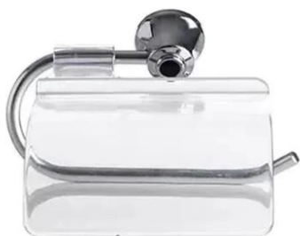
Referência de papeleira metálica cromada

Referência de bacia sanitária com caixa acoplada e assento sanitário