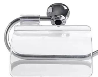
Referência de papeleira metálica cromada