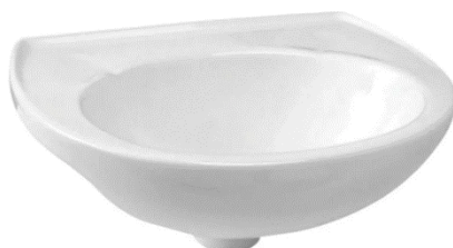
Referência de lavatório suspense