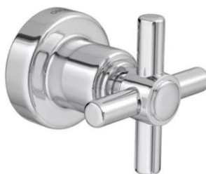
Referência de registro gaveta cromado