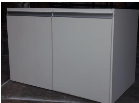
Referência armário da pia